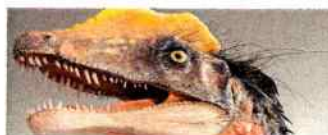
Zázrak prírody - Príbeh života na Zemi The Miracle of Nature - The History of Life on Earth