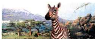
Zázrak prírody - Biodiverzita Zeme The Miracle of Nature - Biological Diversity of Earth