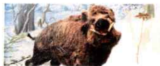
Zázrak prírody - Biodiverzita Slovenska The Miracle of Nature - Biological Diversity of Slovakia