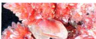
Klenoty Zeme Treasures of Earth